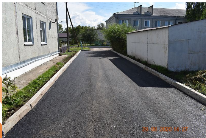
Проект реализован в 2020 году